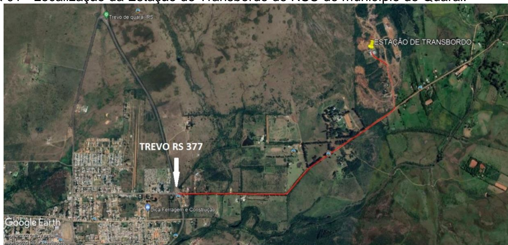
Figura 01 - Localização da Estação de Transbordo de RSU do município de Quaraí.

A Figura 01 apresenta a localização da Estação de Transbordo da CONTRATANTE, ETB (Estação de Transbordo Barrouim), estabelecida na Estrada do Meio, Barrouim/Sanga da Areia, 1º Distrito de Quaraí/ RS, Coordenadas Geográficas Graus Decimais Lat. -30,349791° e Lon -56,430749°.